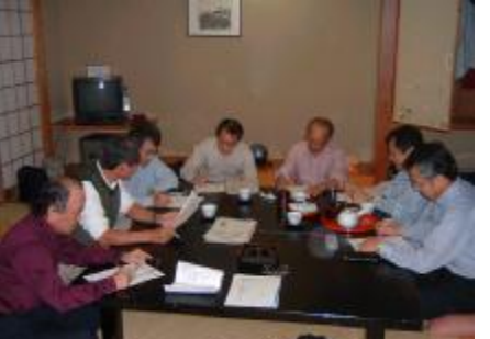
定例役員会の様子

係で途中からやむなく引き返された方もおりました。役員は4時30分に集合し、定例役員会を開催しました。