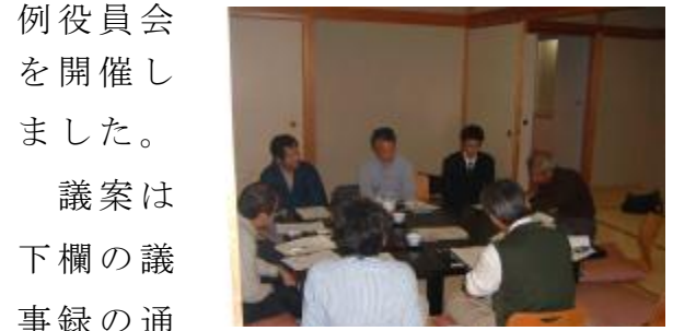
フリーディスカッションの様子

係で途中からやむなく引き返された方もおりました。役員は4時30分に集合し、定例役員会を開催しました。