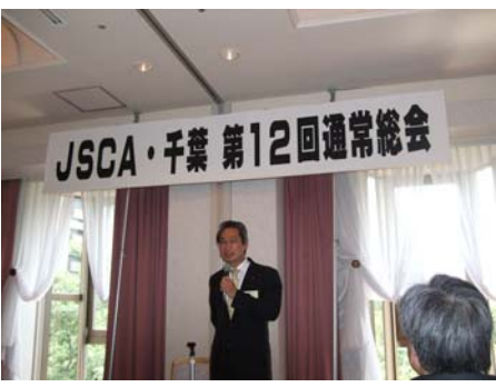
第12回通常総会の準備風景

・法に準拠した行動、業務責任と報酬のバランス、さらに公益法人化を目指すJSCAの活動と社会的